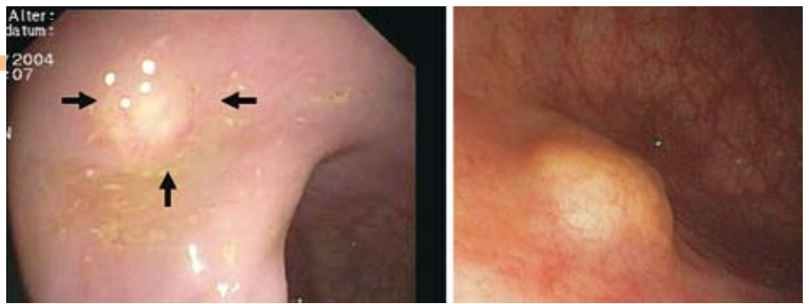
Abb. 3: Endoskopische Bilder von kleinen (< 1cm) Rektumkarzinoiden. Modifiziert nach Scherübl & Klöppel. Rektumkarzinoide auf dem Vormarsch. Z Gastroenterol 46, im Druck (2008).

Zeigen diese kleinen (< 1 cm) neuroendokrinen Magentumore feingeweblich einen guten Differenzierungsgrad und sind sie nicht in die Blut- oder Lymphgefäße eingebrochen, so können sie im Rahmen der Magenspiegelung durch das Endoskop abgetragen, d.h. entfernt werden. Im Falle von kleinen Tumoren des Magens kann heutzutage also oftmals auf eine offene Bauchoperation verzichtet werden; die endoskopische Abtragung erfolgt durch einen Magen-Darm-Spezialisten (Gastroenterologen) über den eingeführten Magenschlauch, das Endoskop. Der Patient erhält eine Kurznarkose und schläft während der Untersuchung. Vor der endgültigen Therapieplanung hat eine endoskopische Ultraschalluntersu-